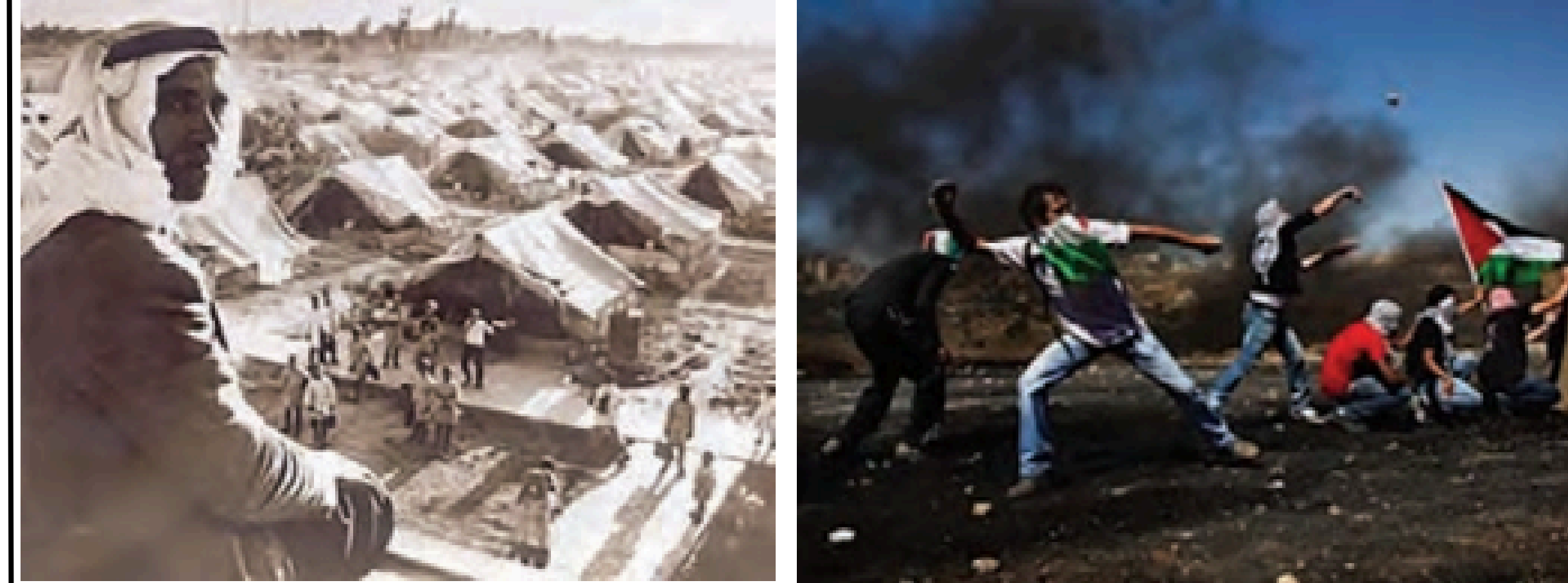
ملت فلسطین در داخل یا خارج فلسطین برآکنده شدند ولی به مبارزه ادامه داده و سعی در بازیگیری سرزمینشان کردند.

در دهه‌های بعد، رژیم اسرائیل به قطعنامه سازمان ملل پایبند نماند و به تدریج، تقریباً تمامی سرزمین فلسطین را تحت اشغال نظامی یا محاصره قرار داد. مردم فلسطین از ابتدایی‌ترین حقوق انسانی خود، از جمله مالکیت زمین، آزادی رفت و آمد و حق تشکیل دولت مستقل، محروم شدند. شهرک‌سازی‌های غیرقانونی، ایست‌های بازرسی گسترده و اعمال مکرر خشونت از سوی ارتش اسرائیل، زندگی روزمره فلسطینی‌ها را با اختلال جدی مواجه کرد. شرایط به گونه‌ای بود که مجمع عمومی سازمان ملل، در یکی از قطعنامه‌های خود، صهیونیسم و دولت اسرائیل را مصداق نژادپرستی و تبعیض نژادی اعلام کرد. ۱