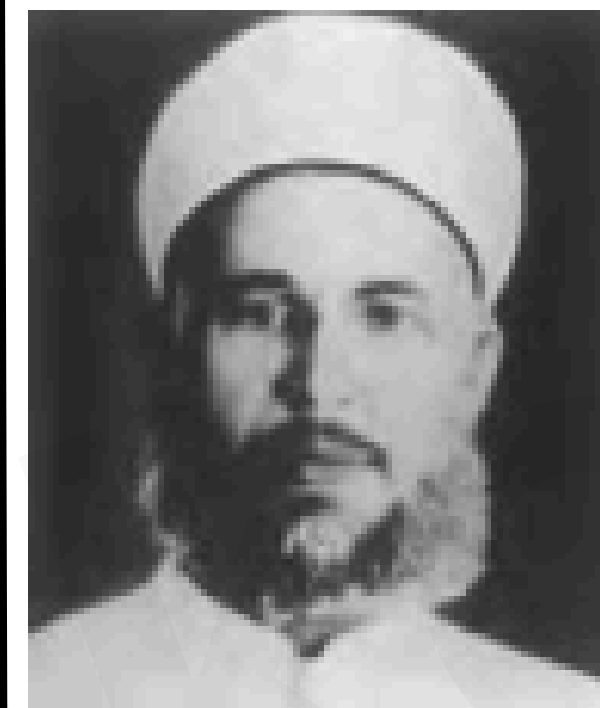
عزالدین حسنین (۱۸۸۲-۱۹۳۵) رهبر قیام مردمی فلسطین و برجدار مبارزه با صهیونیست‌ها بود و چند سال قبل از تشکیل اسرائیل به نهادت رسید.

آموزش و تجهیز نظامی مهاجران صهیونیست: ارتش انگلستان گروه‌های نظامی صهیونیست را آموزش داده و سازمان‌دهی و مسلح کرد. این در حالی بود که فلسطینی‌ها از حمل سلاح منع شده بودند و نهادهای اطلاعاتی بریتانیا به‌طور مستمر هسته‌های مقاومت مردمی را شناسایی و سرکوب می‌کردند.