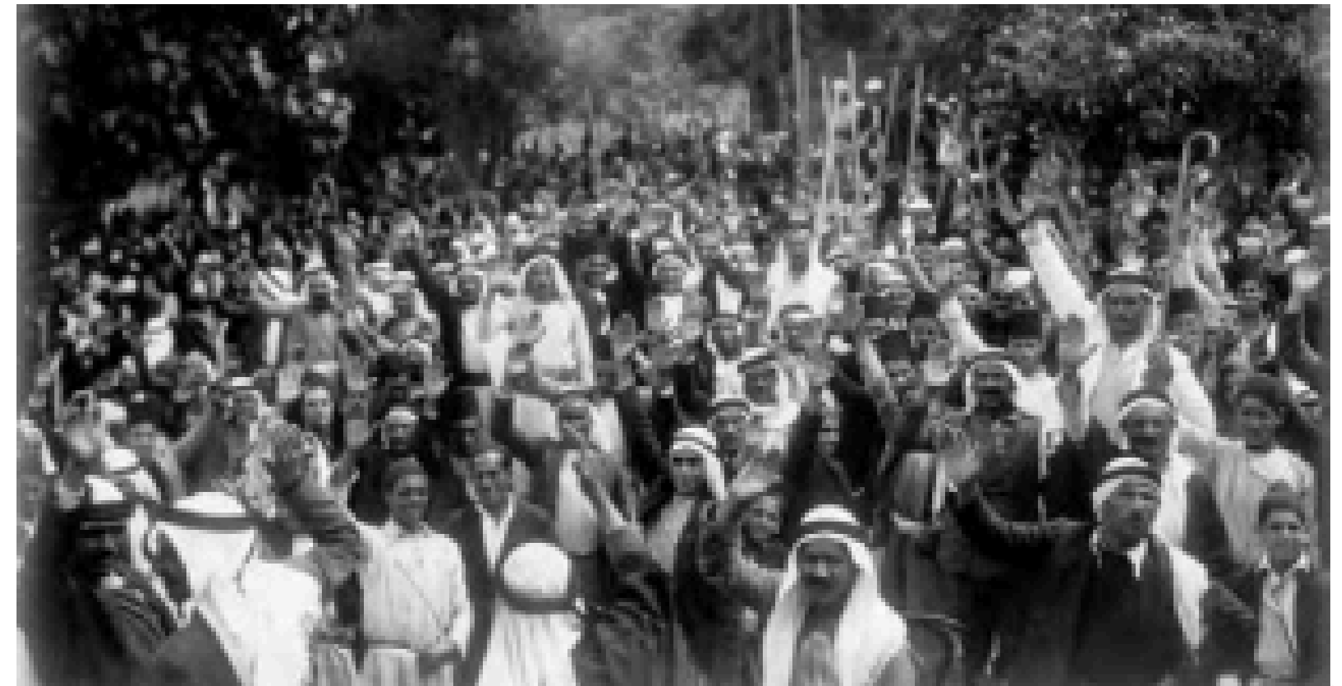
تظاهرات و اعتصاب فلسطینی ها در قفس تر اخراجی به مهاجرت یهودیان