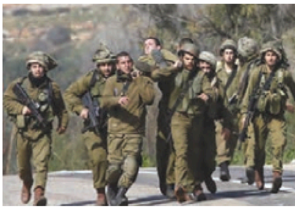
پس از پیروزی حزب الله لبنان در جنگ ۲۲ روزه به رهبری سید حسن نصرالله و پیروزی مقاومت غزه در جنگ ۲۲ روزه و ۸ روزه، افسانه شکست‌ناپذیری صهیونیست‌ها فروریخته است.

با تشکیل دولت جعلی اسرائیل در غرب آسیا و در قلب دنیای اسلام، استعمارگران نه تنها بر این منطقه مهم دست پیدا کردند بلکه یک هدف بلندمدت استعماری هم دنبال می‌شد، زیرا ادامه حیات و فعالیت اسرائیل، این تضمین را به صهیونیست‌ها می‌دهد که اگر زمانی دولت اسلامی مقتدری در این منطقه به وجود آمد، اسرائیل با آن مقابله کند و بتواند جلوی نفوذ آنها را بگیرد. بنابراین دستیابی صهیونیست‌ها به قلب دنیای اسلام یعنی فلسطین، باعث تداوم سلطه استعمارگران بر دنیای اسلام است.