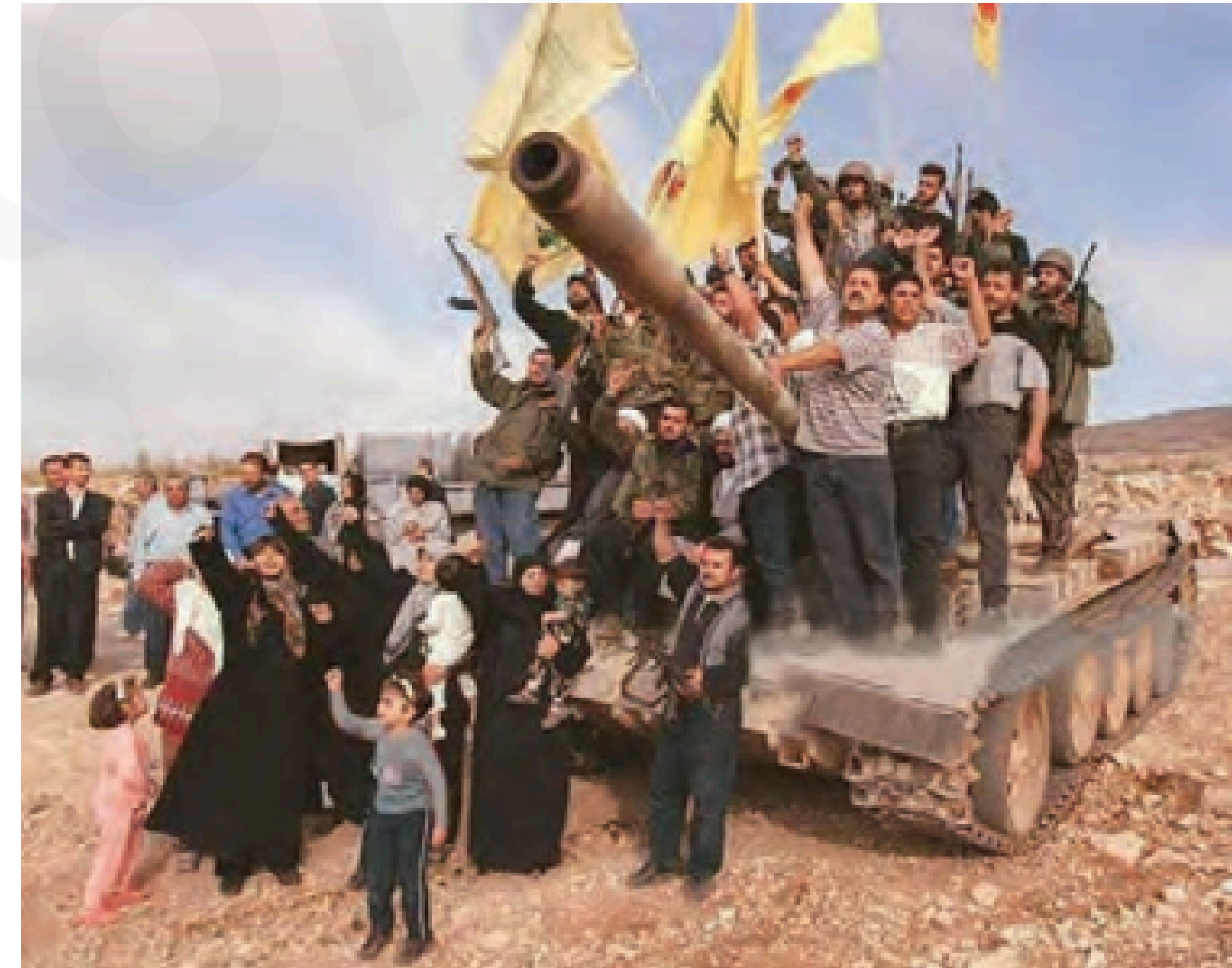
پس از پیروزی حزب الله لبنان در جنگ ۳۳ روزه به رهبری شهید سید حسن نصرالله و پیروزی مقاومت غزه در جنگ ۲۲ روزه و ۸ روزه و پیروزی ایران در عملیات وعده صادق، افسانه شکست‌ناپذیری صهیونیست‌ها فرو ریخته است.

لبنان در منطقه نقش منحصر به فردی ایفا کرد و برخلاف دیگر کشورهای عربی که با به سازش روی آوردند یا در مبارزه ناکام ماندند، لبنان شاهد ظهور جنبش مقاومت مردمی «حزب الله» بود که با الهام از انقلاب اسلامی ایران، موفق شد در سال ۲۰۰۰ اسرائیل را وادار به خروج کامل از جنوب لبنان کند. این نخستین شکست نظامی اسرائیل در برابر یک نیروی مقاومت مردمی بود که تأثیرات عمیقی بر معادلات منطقه گذاشت. پیروزی مقاومت در لبنان نه تنها افسانه شکست‌ناپذیری ارتش اسرائیل را در هم شکست، بلکه الگویی عملی برای دیگر جنبش‌های مقاومت در منطقه ارائه داد. این موفقیت نشان داد که با وجود نابرابری نظامی، استراتژی مقاومت مردمی و پایداری می‌تواند در بلندمدت مؤثر واقع شود.